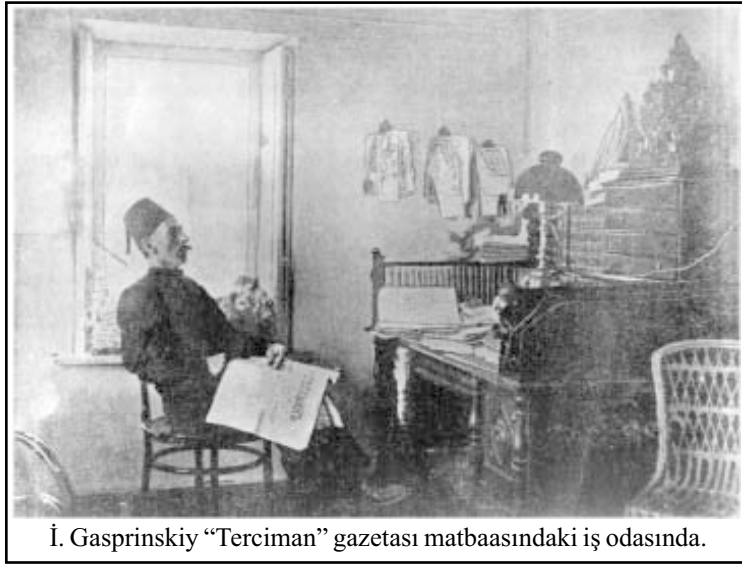
İ. Gasprinskiy “Terciman” gazetasi matbaasındaki iş odasında.

20 oktâbr. Qırım Haberleri . (Bağçasaray.) Şehirimizde yapılmaqta olan tsement zavodına işçiler kelmeye başladı. Bunların cümlesi 500 (beş yüz) kişi olacağından şehirimiz ticarete bayağı faideli olacağı malumdur.