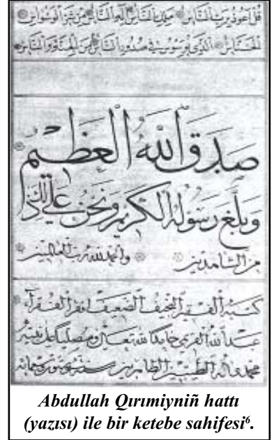
Abdullah Qırımiyniñ hattı (yazısı) ile bir ketebe sahifesi 6 .